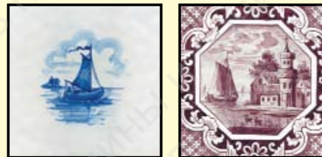
На развороте кафельные печи-голландки из Меншиковского дворца (Санкт-Петербург), печи стоят у стен, облицованных изразцовым карлажем. И кафель на печах, и изразцы на стенах расписаны в стиле дельфт.